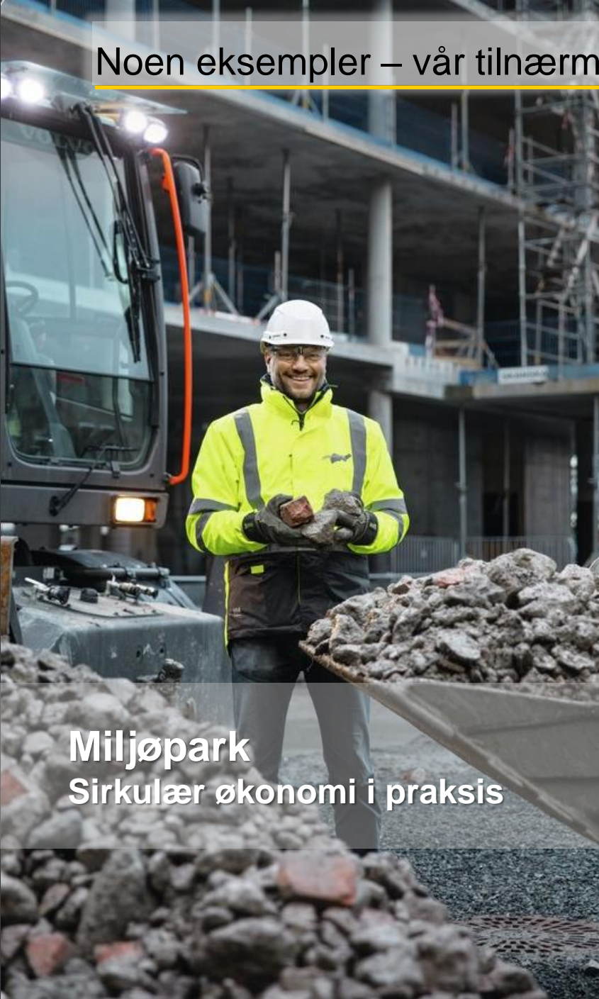
Miljøpark Sirkulær økonomi i praksis