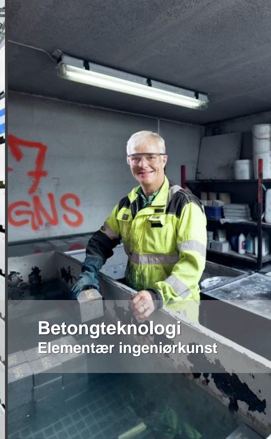
Betongteknologi Elementær ingeniørkunst